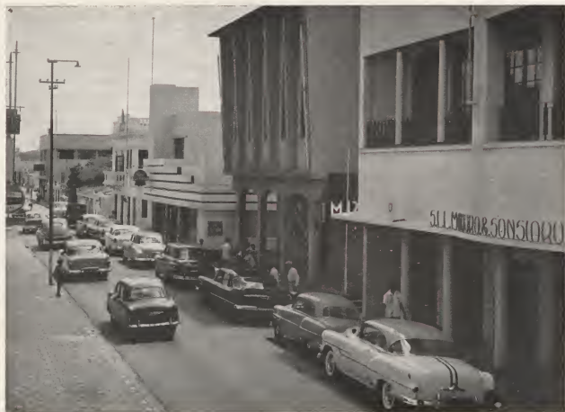
A main artery of economic activity: Nassaustraat, Oranjestad